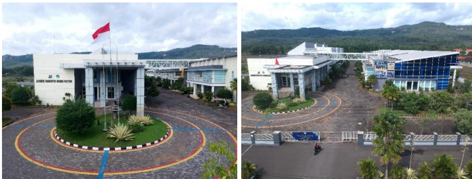
Gambar 1. Lahan Kampus Akademi Komunitas Negeri Pacitan

Akademi Komunitas Negeri(AKN) Pacitan didirikan berdasarkan Peraturan Menteri Pendidikan dan Kebudayaan Nomor 94 Tahun 2013 tentang Pendirian, Organisasi, dan Tata Kerja Akademi Komunitas Negeri Pacitan yang ditetapkan pada tanggal 11 Oktober 2013 dan diresmikan oleh Presiden Republik Indonesia pada tanggal 16 Oktober 2013, sehingga sekaligus pada tanggal 16 Oktober ditetapkan sebagai hari jadi ( dies natalis ) AKN Pacitan. Sejarah sebelum menjadi nama Akademi Komunitas yaitu, pada awal tahun 2012 Politeknik Elektronika Negeri Surabaya (PENS) bekerjasama dengan beberapa kota di Indonesia membuat program pendidikan Community College dengan jenjang diploma 1. Pada tahun 2012, sesuai dengan kebijakan pemerintah mengenai pendidikan Tinggi, Community College berubah nama menjadi PDD (Program Studi di Luar Domisili). Dengan adanya Permendikbud 48 tahun 2013[5], Program studi di luar domisili berubah nama menjadi Akademi Komunitas Negeri Pacitan.